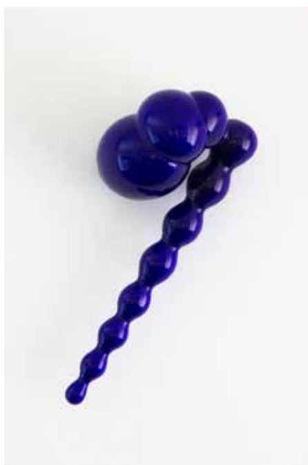
Dorothé Jehoel Blauw gecoat kunststof 50 x 20 x 18 cm