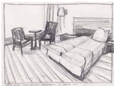
Bas Kwakman, 2014 19 x 25 cm