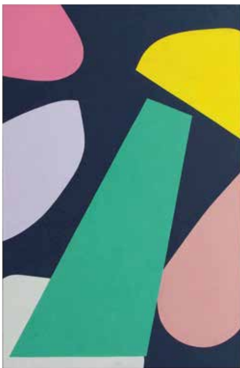
Frans Franssen 2015 Olieverf op linnen 283 x 185 cm