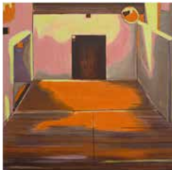
Fred van Eldijk 2015 Olieverf op doek 60 x 60 cm

www.studiovandusseldorp.nl info@studiovandusseldorp.nl open do t/m zo van 1300-1700 uur en op afspraak