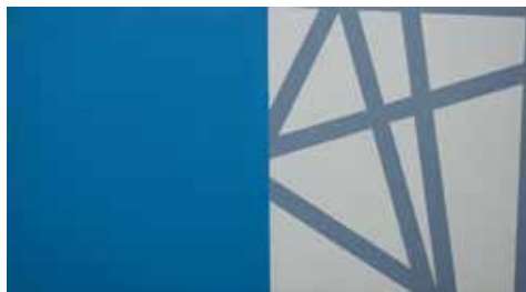
André Geertse, 2013 Olieverf op doek 37 x 68 cm