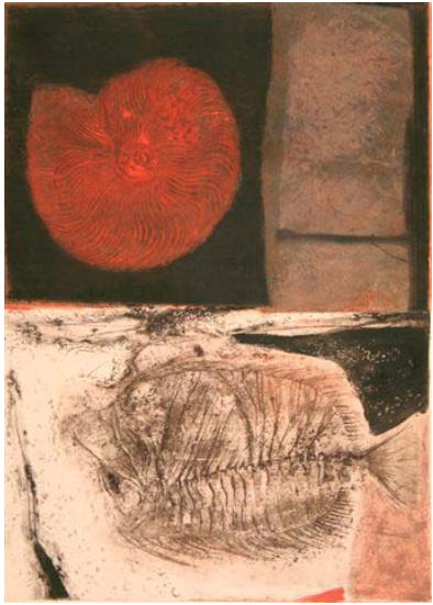
La Vie Perdue III 1980 49,5 x 69,5 cm.